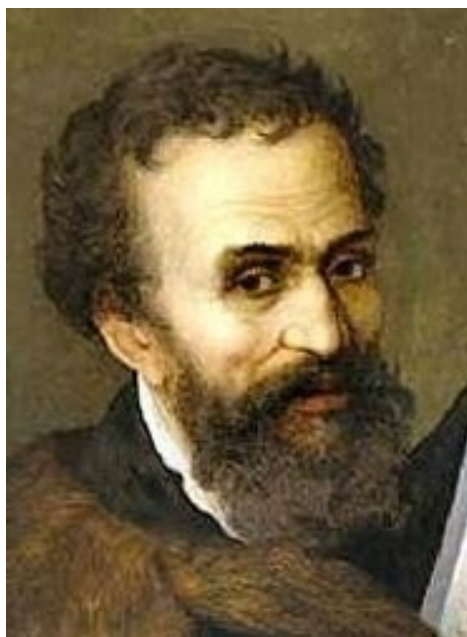
Michelangelo Buonarroti (1475 – 1564) (Michel-Ange)